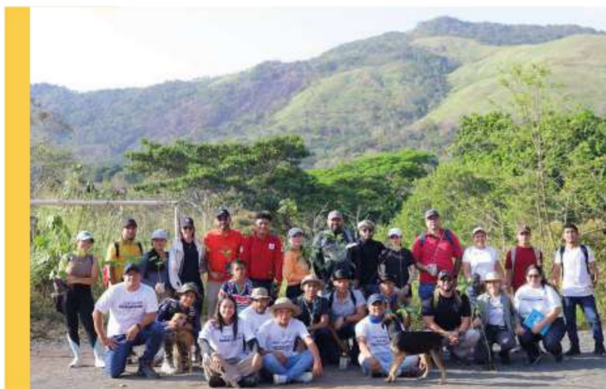
Creadores del Turismo Regenerativo al Cerro Cabra.

El objetivo final de Destino Arraiján no es solo atraer turistas, sino enriquecer la vida de los residentes y fortalecer la economía local. Este plan se construye sobre la premisa de que un Arraiján próspero y atractivo turísticamente beneficia a todos los que llaman a nuestra comunidad su hogar.