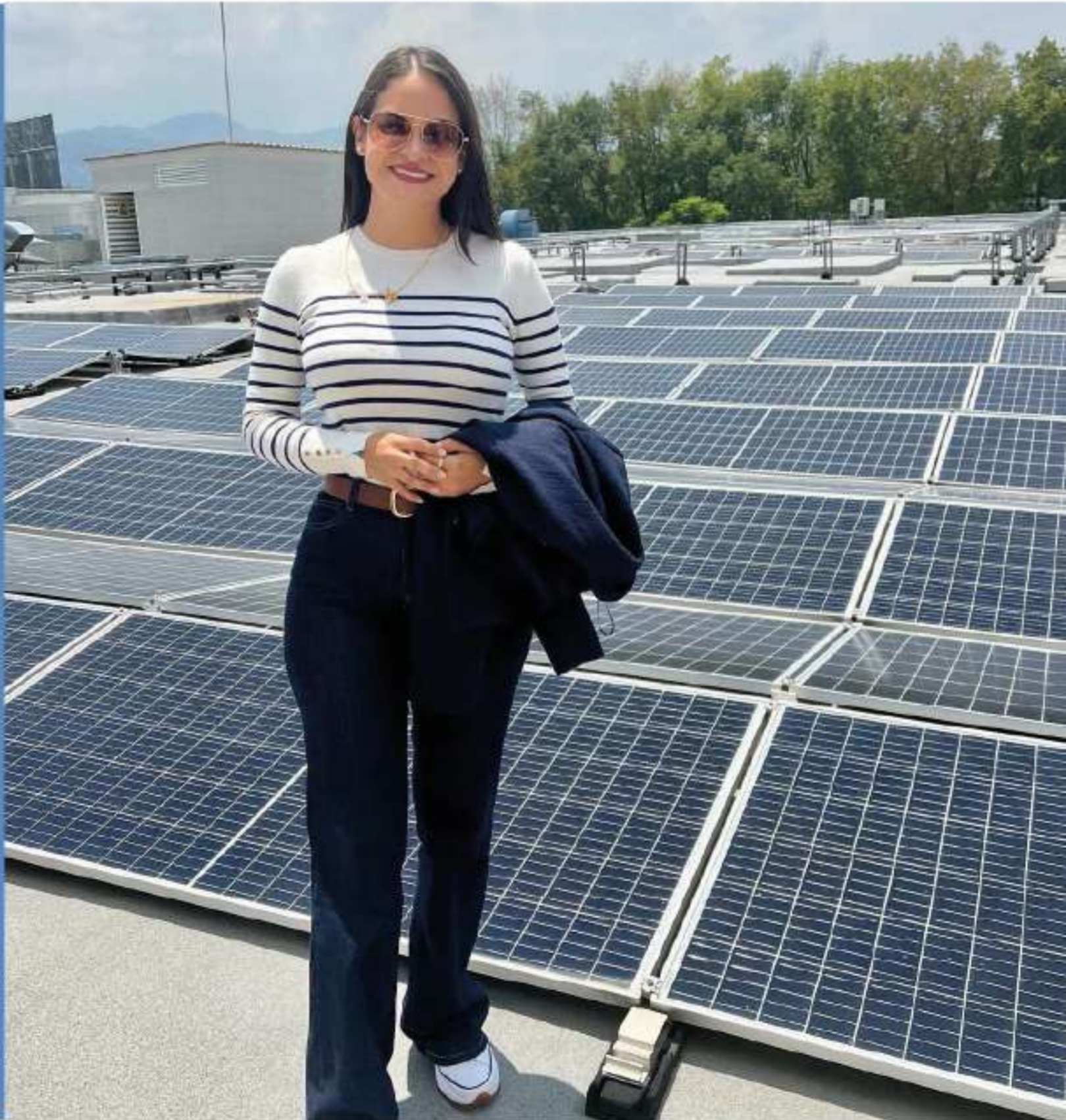
Visita a Granja Fotovoltaica en Puebla, México.

Participación Comunitaria: Involucrar a la comunidad en la transición hacia la eficiencia energética fortalecerá el sentido de responsabilidad compartida y construirá una Arraiján más consciente y sostenible.