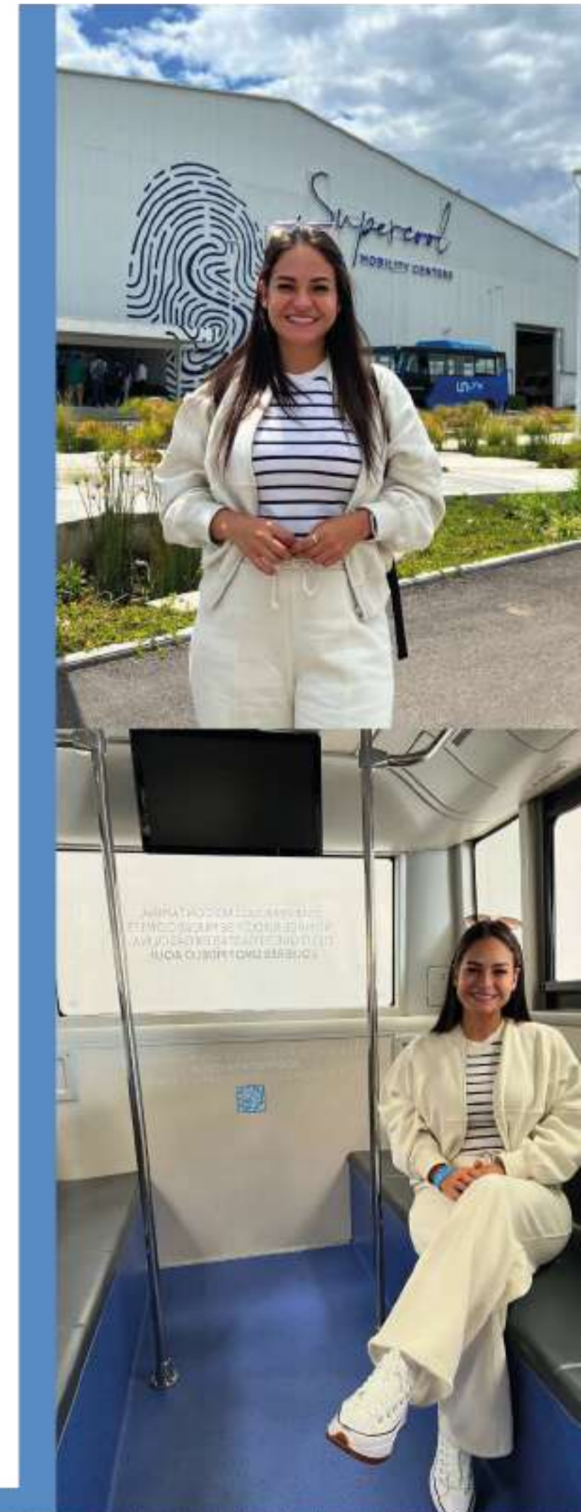
Visita a Centro de Movilidad Eléctrica en México.

“ Arraiján Conectado ” es una visión para transformar la movilidad en el distrito, brindando a los residentes una opción de transporte público eficiente y sostenible. Este proyecto representa un compromiso con un Arraiján más conectado, accesible y amigable con el medio ambiente.