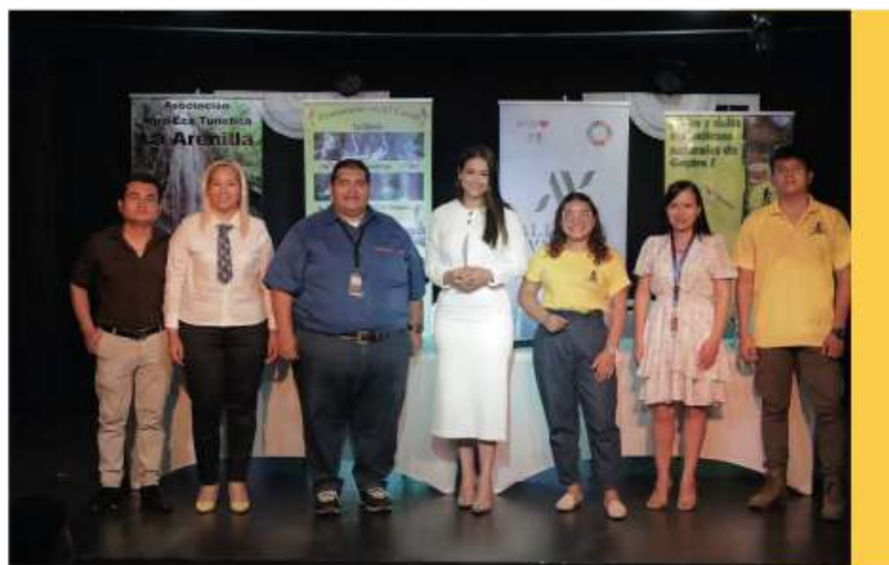
Co-Fundadores de la Red de Promotores Turísticos de Panamá Oeste