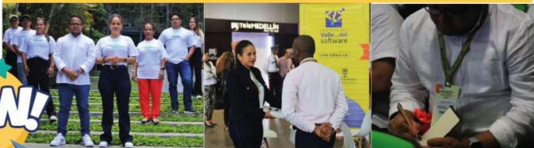
Conferencia de buenas prácticas de innovación y tecnología con Amazon, Google y Mercado Libre.