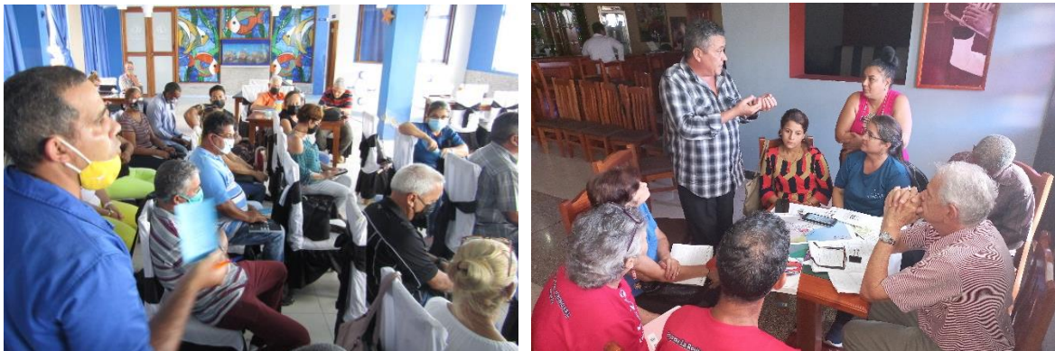
Figura 1. Actores clave en talleres de mayo y octubre 2022

Posteriormente, durante los talleres desarrollados en mayo 2022, octubre 2022 y septiembre 2023 se incorporaron otros actores clave a nivel nacional, provincial y municipal de los sectores público y privado, involucrándose de esta manera en la ejecución del proyecto. Además, en junio de 2022, se creó el grupo de divulgación del proyecto “Nature4Cities-Manzanillo”, para fortalecer la comunicación entre el equipo de coordinación y los miembros del Grupo de Trabajo de SbN, el cual tiene hasta la fecha 30 miembros.