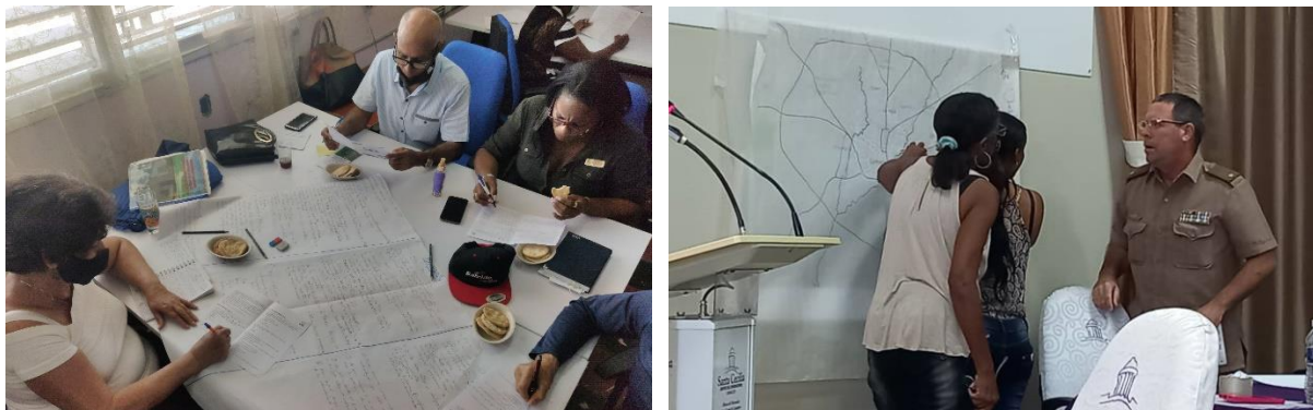
Figura 1. Actores clave en talleres de mayo y octubre 2022

Posteriormente, durante los talleres desarrollados en mayo 2022, octubre 2022 y septiembre 2023 se incorporaron otros actores clave a nivel nacional, provincial y municipal de los sectores público y privado, involucrándose de esta manera en la ejecución del proyecto. Además, en junio de 2022, se creó el grupo de divulgación del proyecto “Nature4Cities-Camagüey”, para fortalecer la comunicación entre el equipo de coordinación y los miembros del Grupo de Trabajo de SbN, el cual tiene hasta la fecha 24 miembros.