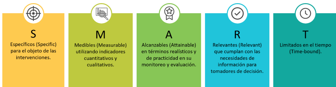
Figura 2. Criterios SMART.

Por tanto, los indicadores propuestos deben cumplir a su vez con los criterios SMART: